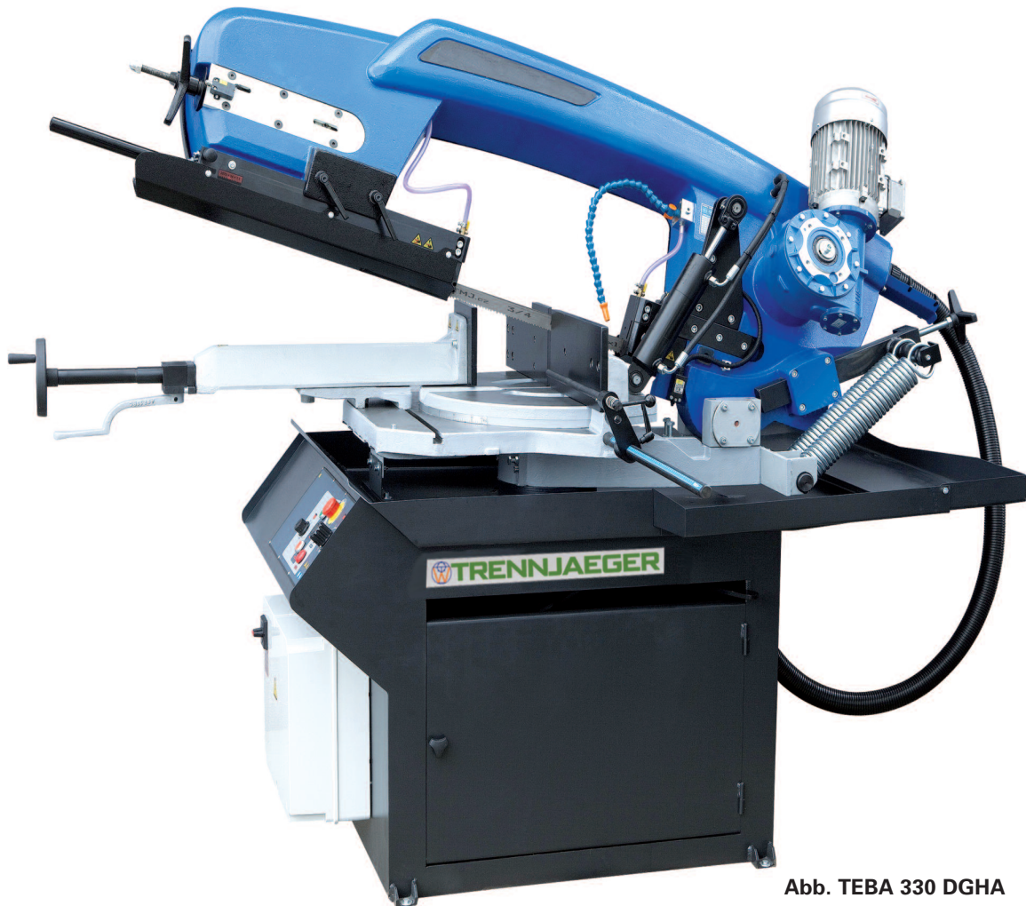
Abb. TEBA 330 DGHA