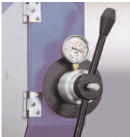
Bandspannung mit Manometer