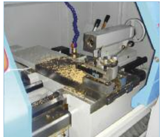
Steuerung und Handräder SIEMENS 802 C 3-Backenfutter zugänglich Innenansicht